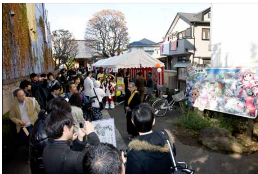
秋の八王子の「いちよう祭り」に併せて行った「了法寺メイドカフェ」今年も11月20日(土)21日(日)で開催します