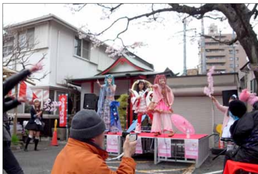
4月4日お釈迦様の誕生を祝う「花祭り」